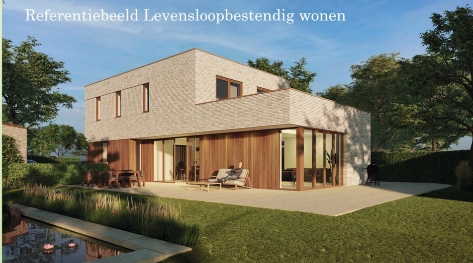
Referentiebeeld Levensloopbestendig wonen

Ca. 200m 2 woonoppervlakte Ruime plattegronden Uitgebreide optiemogelijkheden Parkeren op eigen kavel