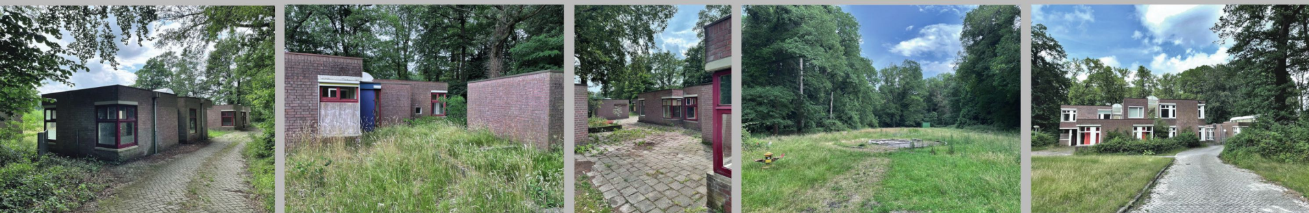
Foto's bestaande situatie

“wonen op het voormalig landgoed Teesink”