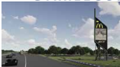
Landmark McDonald's Langs de A1 bij Apeldoorn-Zuid.