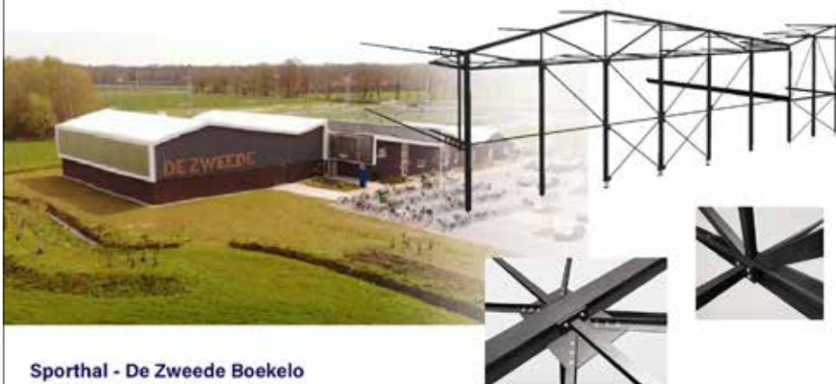
Sporthal - De Zweede Boekelo